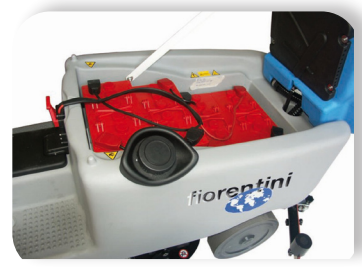
batterie al gel o acido con grande autonomia Lead acid or gel batteries with great autonomy