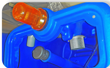
capacità serbatoio molto grande very large tank capacity